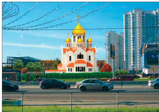
Проект Храма в честь Святого царя-страстотерпца Николая II

Начато строительство нового храмового комплекса в