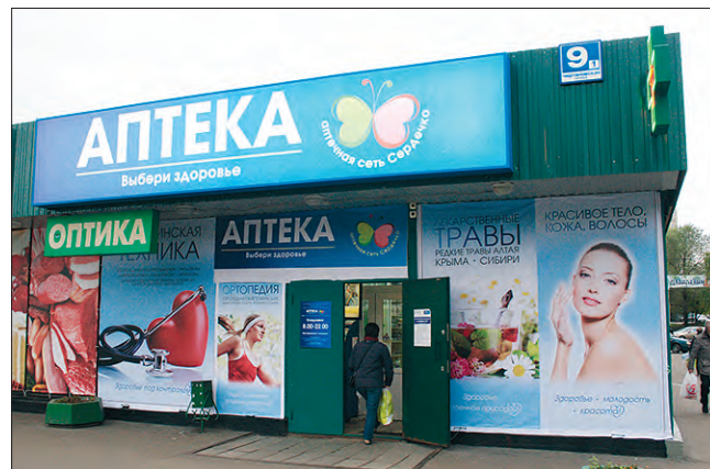
Аптека «Сердечко на Чертановской», ул. Чертановская, д. 9, кор. 1, тел. (495) 312-06-32

Низкие цены на товары аптечного ассортимента удается поддерживать благодаря рациональному использованию всех ресурсов и научной организации труда, в том числе автоматизации и компьютеризации бизнес-процессов. При этом сеть имеет возможность закупать всю аптечную продукцию по прямым поставкам либо крупным