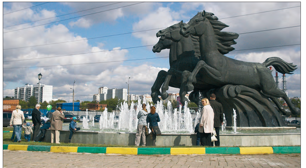
У входа в КСК «Битца», 2007 год

За эти годы комплекс неоднократно менял своих руководителей, но неизменной оставалась забота о лошадях и