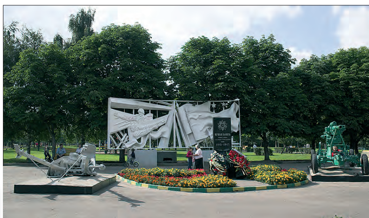
Парка 30-летия Победы в наши дни