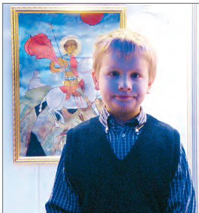
На выставке рисунка «Божий мир глазами ребенка»

ствительно правда. Вот, к примеру, восьмиминутный мультфильм под названием «Мост». Все действие происходит в России, в городе на