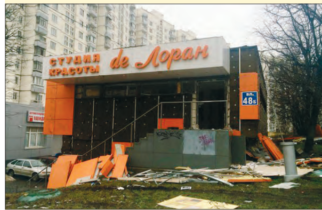
Продуктовый магазин и студия красоты, ул. Чертановская, 48Б

И местные жители с теплотой относились к таким магазинчикам, считая их своими. Сюда не нужно было приманивать посетителей с помощью каких-то химических ароматов, как в крупных торговых центрах. Здесь был привычный ассортимент, знакомые продавцы, и все это укрепляло в сознании людей веру в некую ста-