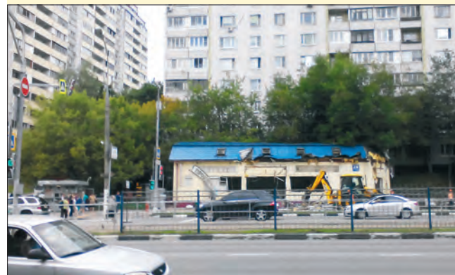
Магазин «Продукты», ул. Чертановская, 28, вл. 2

Уходящий год запомнится жителям Чертанова различными переменами в окружающей жизни, в том числе, к лучшему. Но сейчас не об этом.