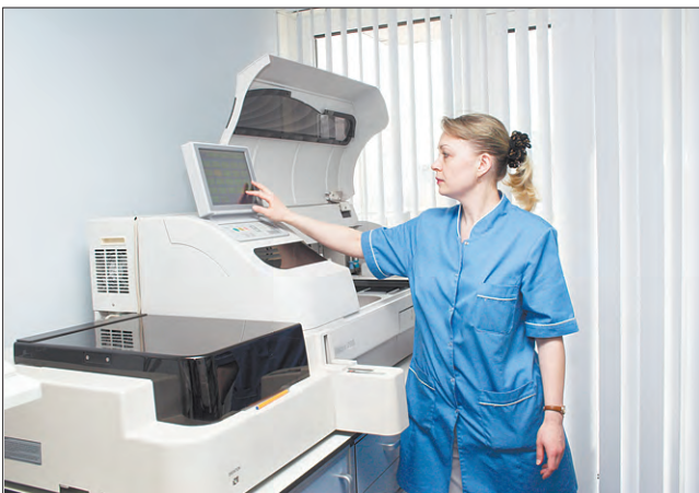
На одном из участков лаборатории

— Во время вакцинации в организм человека вводятся либо живые, но ослабленные микроорганизмы, либо их токсины или антигены. В обоих случаях человеку вводят вакцину или токсин, которые сами по себе не вызывают заболевания, но стимулируют иммунную систему, делая ее способной распознать и атаковать определенный микроорганизм. Это дает организму частичную или полную устойчивость к возбудителю данного заболевания, то есть иммунитет. Но, к сожалению, не всегда.