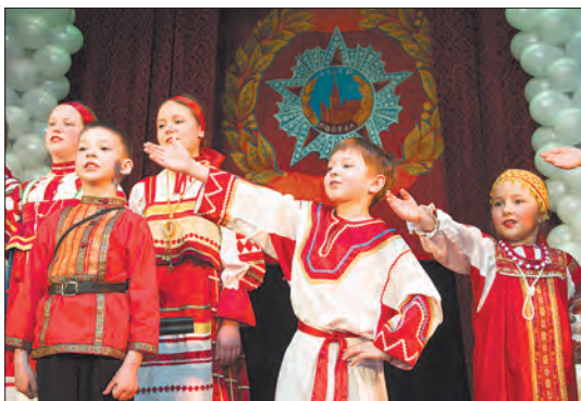
Выступает ансамбль «Колокольцы»

После антракта началось второе отделение концерта, в котором при-