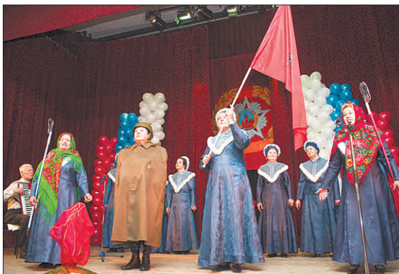
Композицию «Москва военная» исполняет хор «Северное сияние»

Огромное удовольствие всем зрителям и участникам фестиваля доставили яркие и эмоциональные выступления