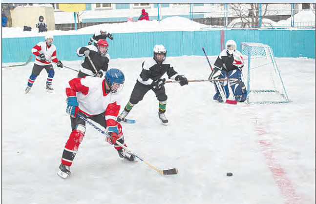
Хоккейный матч между командами Чертанова Северного и Чертанова Южного

Последний месяц зимы в Чертанове Северном был богат спортивными событиями.