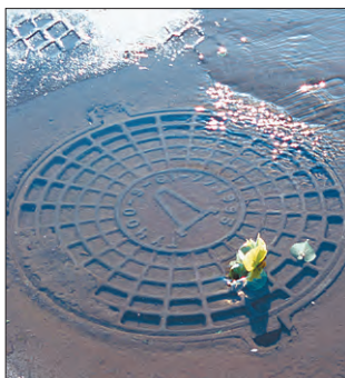
Администрация ГУП «Москоллектор»

За достоверные сведения гарантируем вознаграждение.