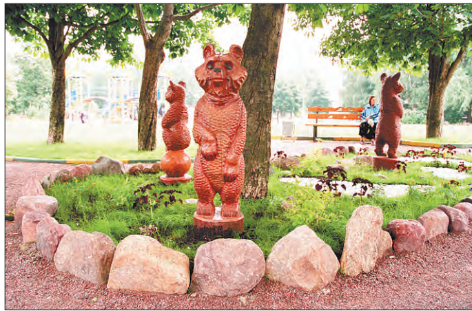
Июль 2004 года