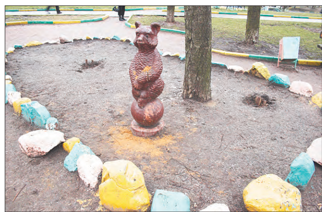
Декабрь 2008 года

К радости всех добропорядочных граждан, опасения оказались напрасными — ни один вандал не поднял руку на медведей. Правда, через пару лет в скульптурах образовались трещины, но это произошло от естественных причин. Специалистам с этой бедой удалось справиться, медведей «подлечили», покрыли лаком и они снова стали лучшим украшением микрорайона. Но в этом году скульптуры были разрисованы подростками-хулиганами и их «художества» пришлось закрасивать тем, что было под рукой. А вскоре два медведя были изуродова-