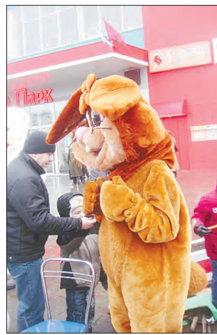
Антон МОРОЗОВ Фото автора