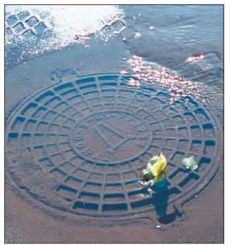
Администрация ГУП «Москоллектор»

Уважаемые жители района Чертаново Северное! ГУП «Москоллектор» информирует Вас, что на территории района происходит хищение чугунных крышек с многосекционных люков колодцев коллекторов. Открытые колодцы представляют собой опасность для людей, животных, транспорта. В коллекторах проложены коммуникации, обеспечивающие жизнедеятельность района, которые могут быть повреждены. Во избежание травм и материального ущерба Вам и Вашему имуществу при попадании в колодцы, а также нарушения целостности подземных коммуникаций, просим информировать Предприятие обо всех случаях обнаружения лиц, снимающих крышки по телефонам: 975-33-51, 607-23-03. За достоверные сведения гарантируем вознаграждение.