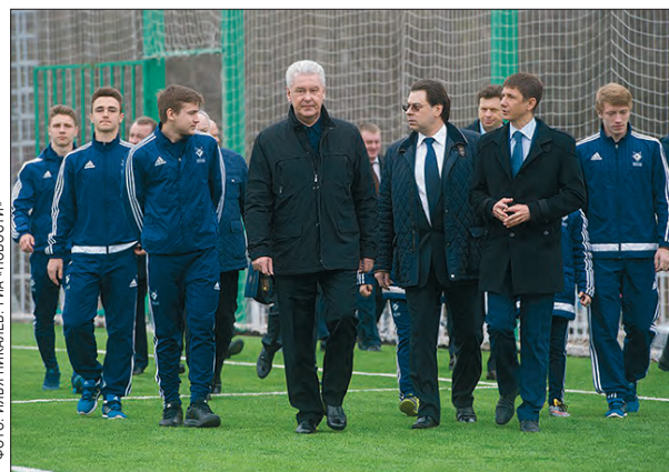
Мэр Москвы Сергей Собянин на открытии всесезонного футбольного поля в районе Чертаново Северное.

В центре «Чертаново» работают 53 тренера и 22 педагога. Помимо нового поля, центр