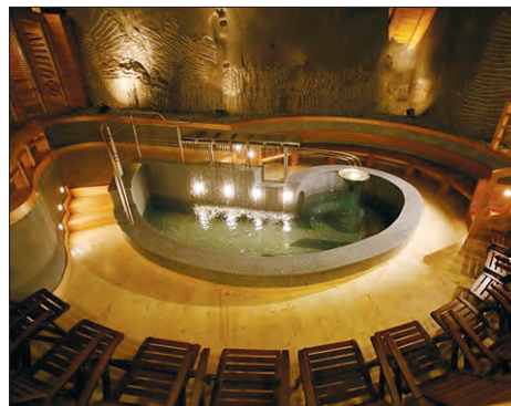
Соляной курорт Величка, Польша

Лечение солью с научным подходом в природных соляных пещерах впервые было применено еще в 19 веке в США. Тогда в штате Кентукки, недалеко от Мамонтова склепа, был открыт первый в мире госпиталь для больных туберкулезом. Хотя и просуществовал он недолго, но эстафету быстро подхватили. Примерно в то же время на нескольких курортах в Италии врачи проводили экспериментальные процедуры с купанием в соленых пещерных водах и спуски в естественные соляные шахты. Но это все были