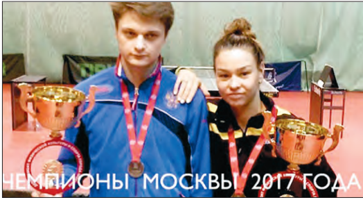
ЧЕМПИОНЫ МОСКВЫ 2017 ГОДА

С 12 по 15 января в спортивном комплексе «Чертаново» проходил Чемпионат города Москвы по настольному теннису среди мужчин и женщин.