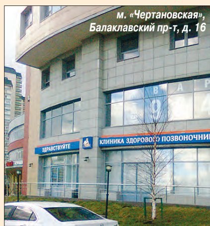
М. «Чертановская», Балаклавский пр-т, д. 16

Вот почему Гиалрипайер выпускается в нескольких модификациях — они специально разработаны для лечения остеоартрозов различного происхождения, периартритов, воспаления сухожилий, суставных сумок, а также остеохондроза.