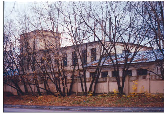
Остатки лабораторного корпуса завода бактериальных препаратов на углу улиц Днепропетровской и Чертановской, 2001 год