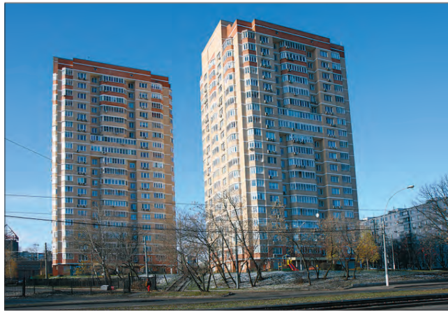
Дом 38 по Чертановской улице, построенный в 2008 году на месте бывшего лабораторного корпуса

На высоком левом берегу в верховьях речки Городенки, к юго-западу от нынешней станции метро «Правая», с XV века находилось село Бирюлево . Здесь располагалась барская усадьба, а рядом, на 17-й версте Серпуховского тракта, первая от Москвы почтовая станция (имевшая до 30 лошадей) с постоянным двором. Первыми владельцами селца были Бирюлевы, давшие ему свое имя. В конце XVII века Бирюлевым владели братья Плещеевы. Затем селцо перешло к П. А. Татищеву, а после его владениями были княгиня А. П. Долгорукая, князь Н. П. Оболенский. После отмены крепостного права земля частично перешла крестьянам. Оставшееся было продано инженер-капитану И. А. Ромейко, ко-