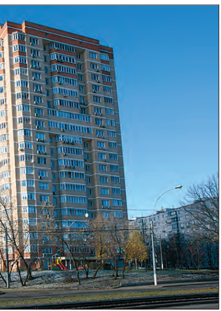
Дом 38 по Чертановской улице, построенный в 2008 году на месте бывшего лабораторного корпуса

Октябрь», в честь только что отмеченной 12-й годовщины Октябрьской революции. В 1949 году у села была открыта платформа Покровская Курской линии железной дороги.