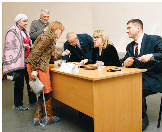
Жители района Чертаново Северное обращаются к депутату на встрече в школе № 1158

По горизонтали: 1. Тесла. 4. Очерк. 8. «Чертаново». 9. Зефир. 11. Таран. 13. Авокадо. 15. Айран. 16. Рента. 17. Корица. 18. Индекс. 19. Цевье. 20. Емеля. 21. Сумская. 25. Бекон. 27. Шуруп. 29. «Локомотив». 30. Терем. 31. Орлан. По вертикали: 1. Топаз. 2. «Анчар». 3. Виадук. 4. Офорт. 5. Кабан. 6. Орлов. 7. Комод. 10. Фейерверк. 12. Ротвейлер. 13. Антарес. 14. Орхидея. 22. Улика. 23. Скамья. 24. Амати. 25. Батут. 26. Налим. 27. Шевро. 28. Перун.