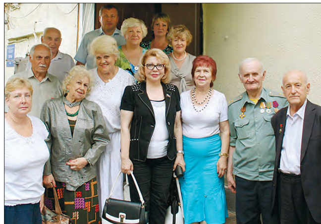
Депутат Госдумы Елена Панина с активом Совета ветеранов Южного округа

жителю района была на встрече депутата с представителями актива местных общественных организаций, которая недавно была организована в здании школы № 1158. Здесь состоялся обмен мнениями о главных вызовах, мобилизующих сегодня