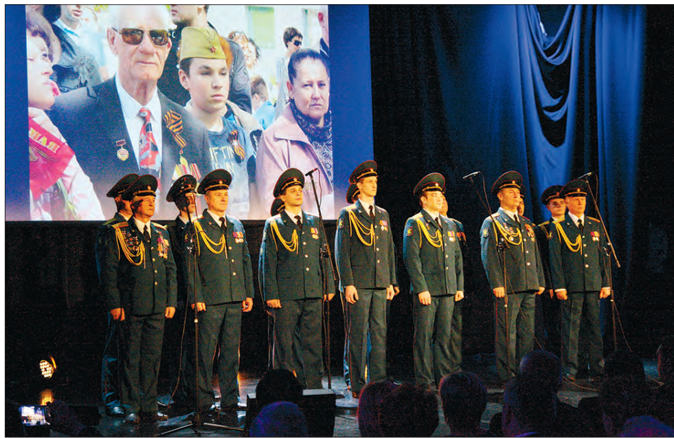
Выступает ансамбль РВСН «Красная Звезда»

17 февраля в Культурном Центре «Северное Чертаново» состоялся концерт, посвященный Дню памяти воинов-интернационалистов, в программе которого выступили участники прославленного ансамбля РВСН «Красная Звезда».