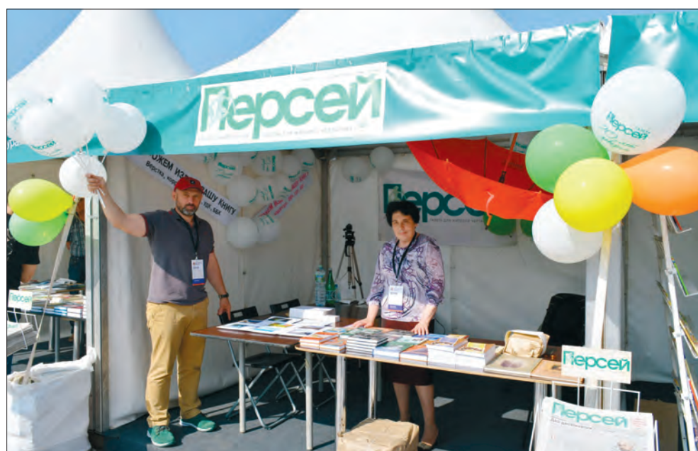
На XVII Фестивале московской прессы, 2019 г.