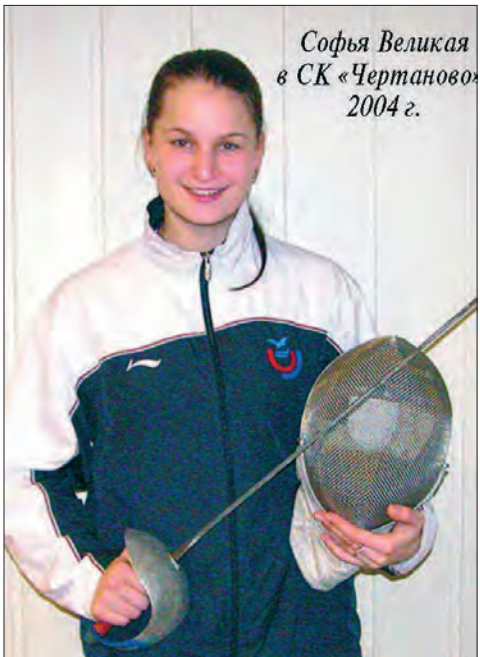
Софья Великая в СК «Чертаново» 2004 г.

На Играх БРИКС, проходивших в Казани, очередную победу одержала двукратная олимпийская чемпионка по фехтованию на саблях, 39-летняя Софья Великая, завоевавшую в финале состязаний